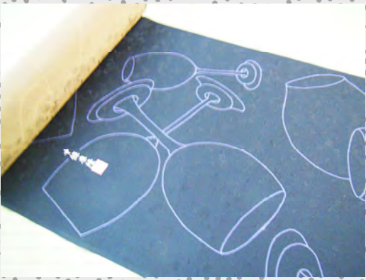
ウィングラスマーカ