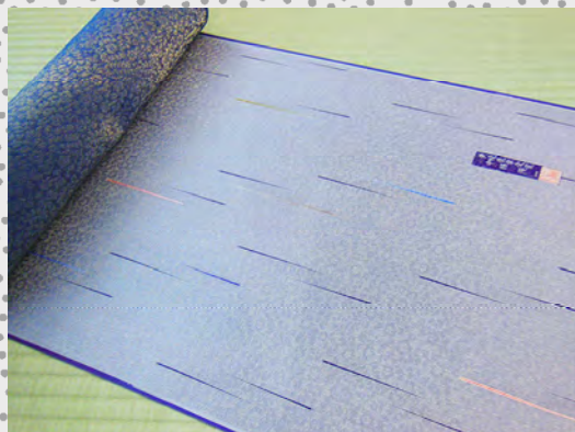
雨縞小紋 (色サシ入) 金ラメ地